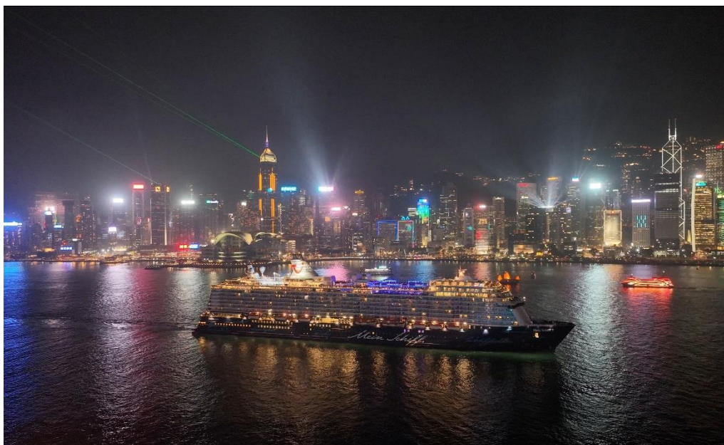
郵輪邁希夫 5 號在 2023 年 3 月 9 日離港時駛經中航道

「幻彩詠香江」匯演，為歡迎旅客回歸的「你好，香港！」活動的成功作出重大貢獻。由傳媒的報道、社交媒體的帖文，以至香港旅遊發展局從世界各地收到的意見可見，郵輪駛經中航道的安排極受郵輪乘客及郵輪公司歡迎。相關報道及帖文亦顯著提升了香港的國際形象。