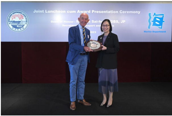
中英船舶管理有限公司获颁发2022年 港口国监督检查杰出表现奖