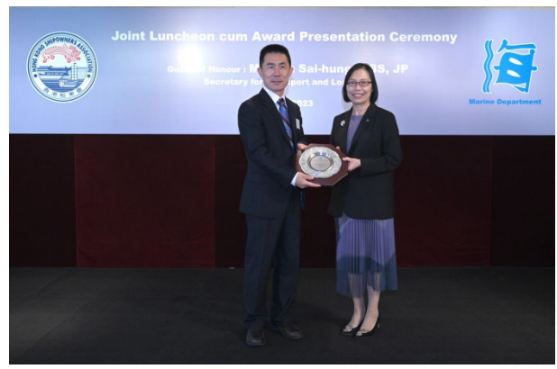
中远海运散货运输有限公司获颁发2022年 港口国监督检查杰出表现奖