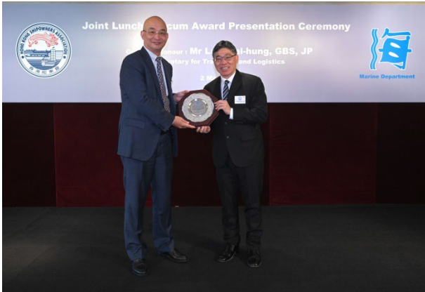
中国远洋海运集团有限公司获颁发2022年 香港船舶注册最高总吨位船东