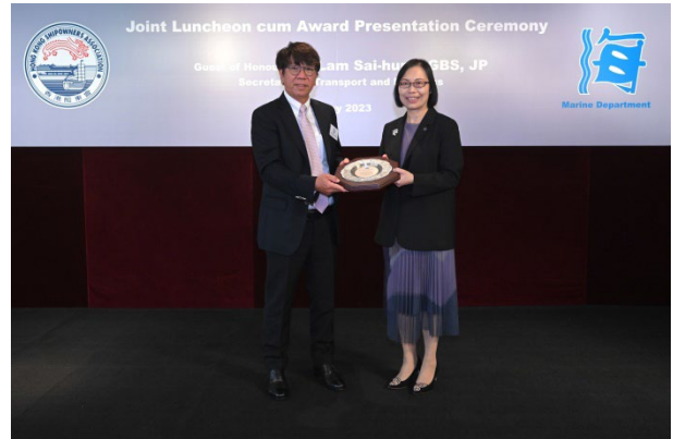
Raffles Technical Services Pte. Ltd. 获颁发2022年 港口国监督检查杰出表现奖