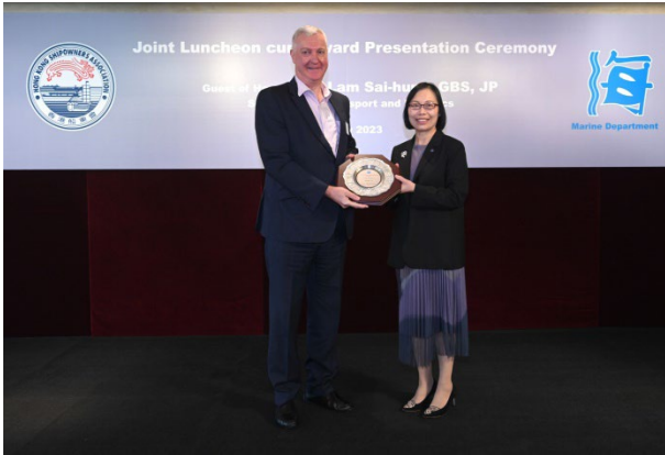
Maersk A/S获颁发2022年 港口国监督检查杰出表现奖