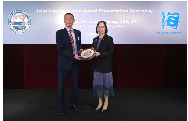
上海远洋运输有限公司获颁发2022年 港口国监督检查杰出表现奖