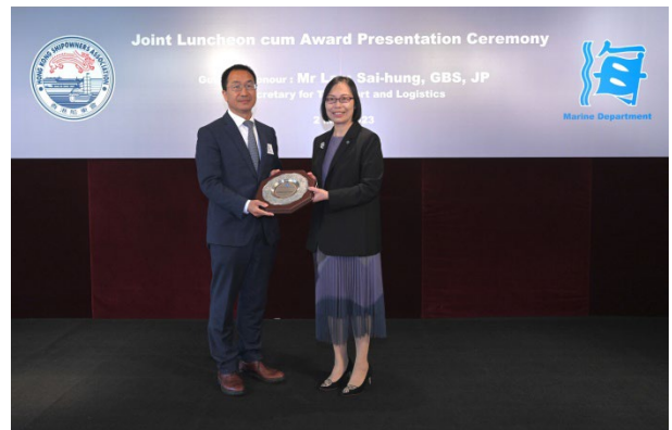
香港明华船舶管理有限公司获颁发2022年 港口国监督检查杰出表现奖