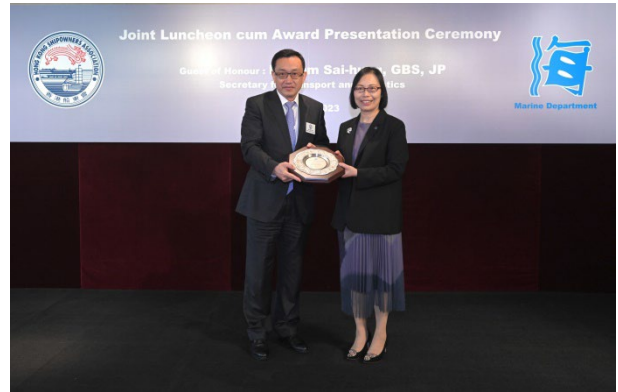
东方海外货柜航运公司获颁发2022年 港口国监督检查杰出表现奖