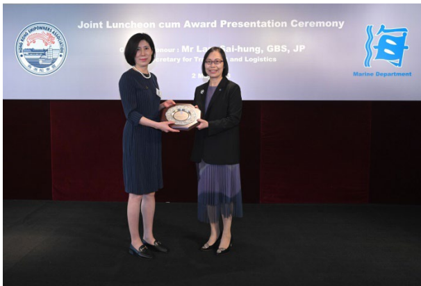
上海海丰船舶管理有限公司获颁发2022年港口国监督检查杰出表现奖