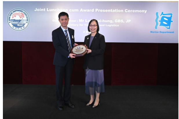
华光船务管理(香港)有限公司获颁发2022年港口国监督检查杰出表现奖