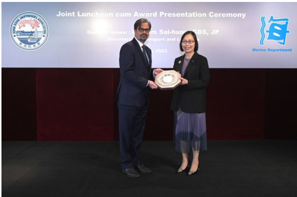
太平洋航运(香港)有限公司获颁发2022年 港口国监督检查杰出表现奖