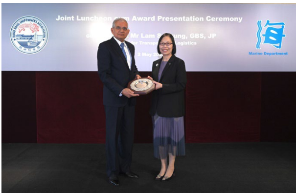
Fleet Management Limited获颁发2022年 港口国监督检查杰出表现奖