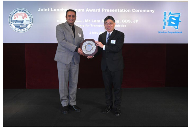
Seaspan Corporation获颁发2022年 香港船舶注册年度新增最高总吨位船东