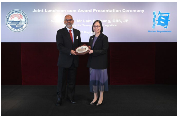
Seaspan Ship Management Ltd. 获颁发2022年 港口国监督检查杰出表现奖