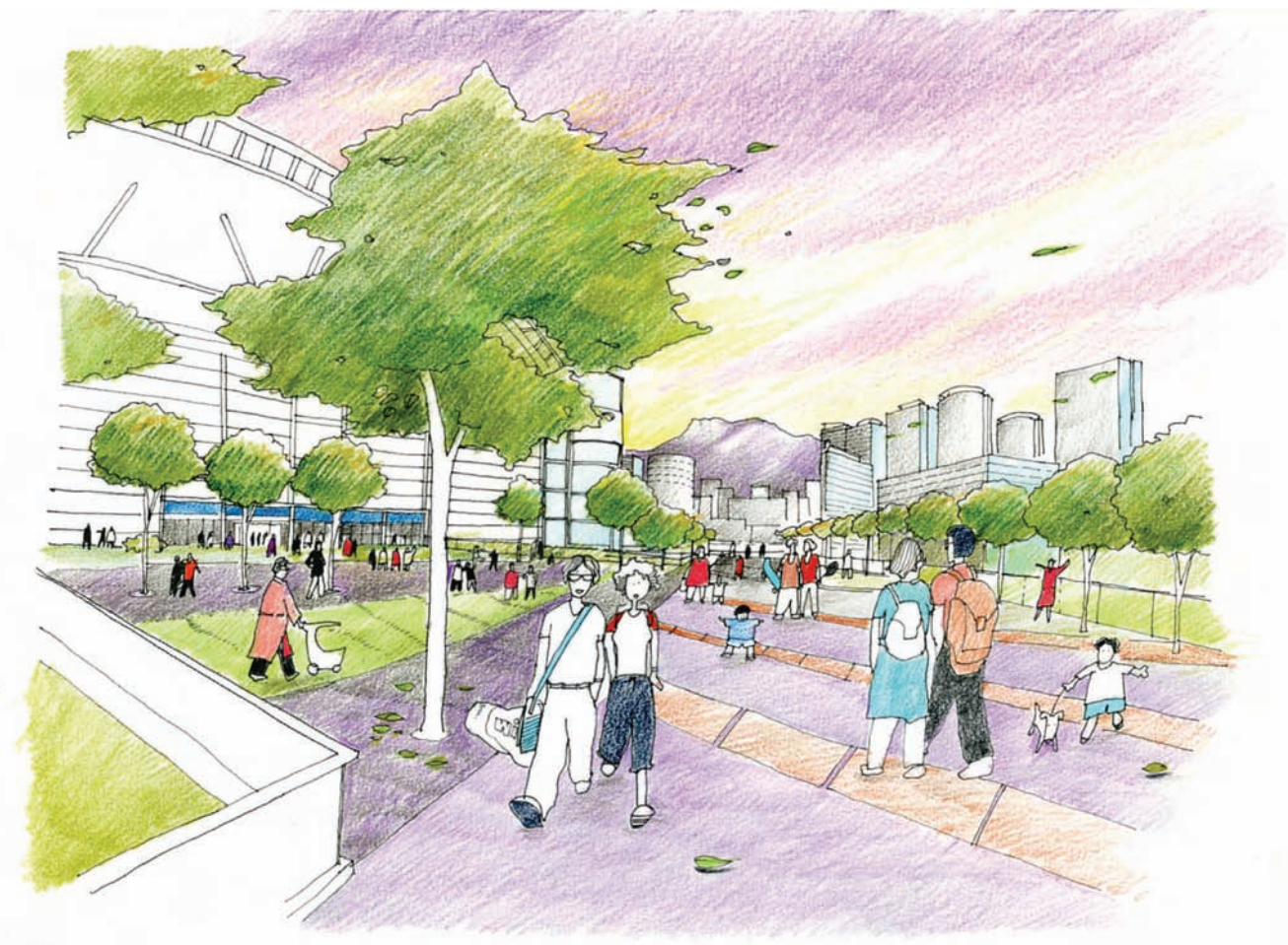
沿景觀廊遠眺獅子山

在總綱圖中將會有不同形態及種類的城市門廊。從維多利亞港進入啟德，郵輪碼頭正是一個主要的城市門廊，而較遠處的都會公園及體育館則成為沿岸的視覺門廊；從火車站進入啟德，綠樹成蔭及擁有綠化休憩空間的車站廣場，正正標誌着另一個重要的城市門廊；從鄰近地區步行至啟德，富有地區特色的行人天橋、行人道及地標性建築將會成為重要的標誌；從其他地區駕車駛入啟德，特色的街道設施、園林設計及路標都成為不可或缺的視覺標記。