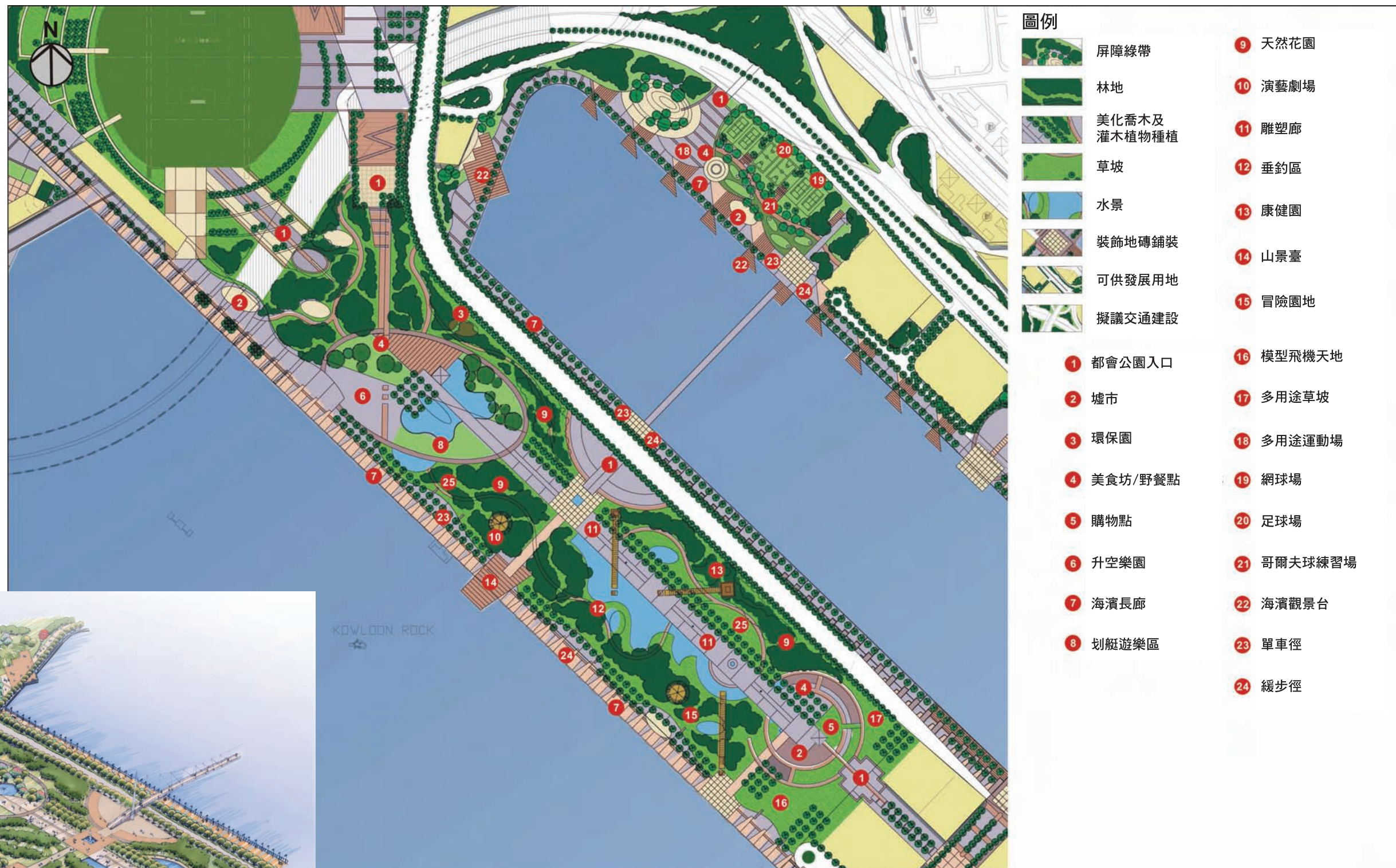
都會公園設計概念圖