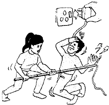
圖 3：接觸傷者前，先切斷電流，或者把傷者與電源分開。 （此圖摘自衛生署出版的《急救手冊》）