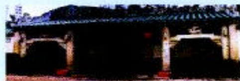
洪聖古廟內的供奉洪聖