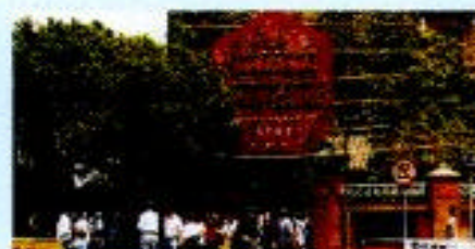
天后廟內的供奉天后娘娘