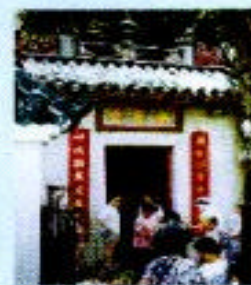
水月宮內的供奉觀世音菩薩