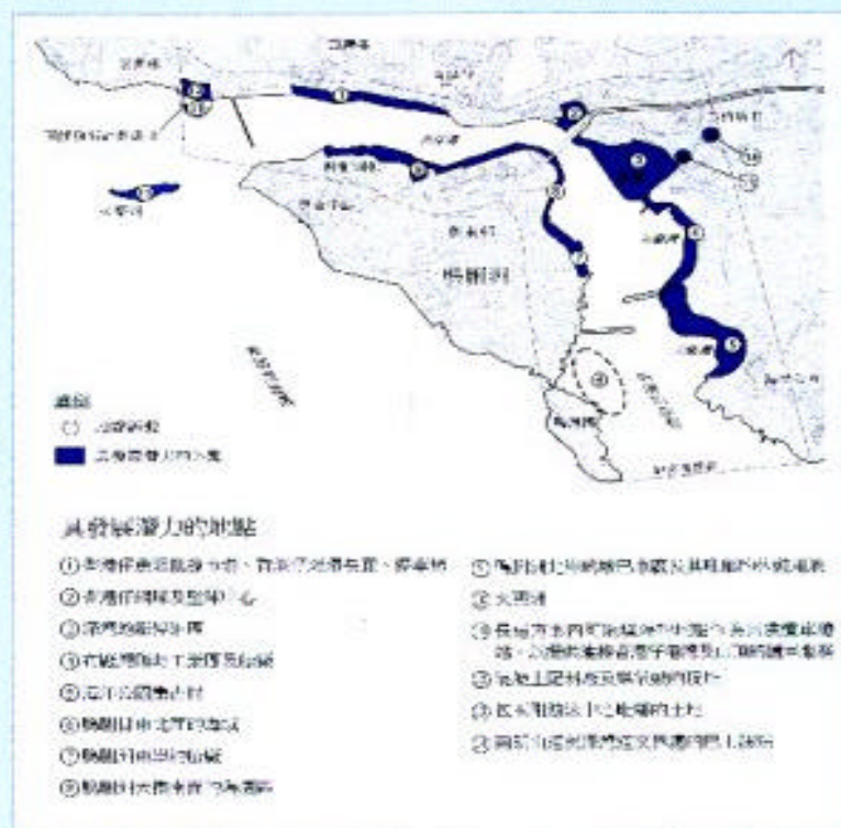
圖 2：具發展潛力的地點

為落實建議的漁人碼頭發展計劃，我們在香港仔港灣內物色到 14 個具發展潛力的地點（圖 2），可作各種旅遊和康樂用途。