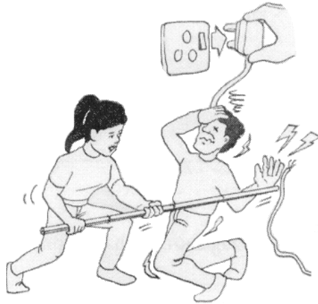
圖 3：接觸傷者前，先切斷電流，或者把傷者與電源分開。 (此圖摘自衛生署出版的《急救手冊》)