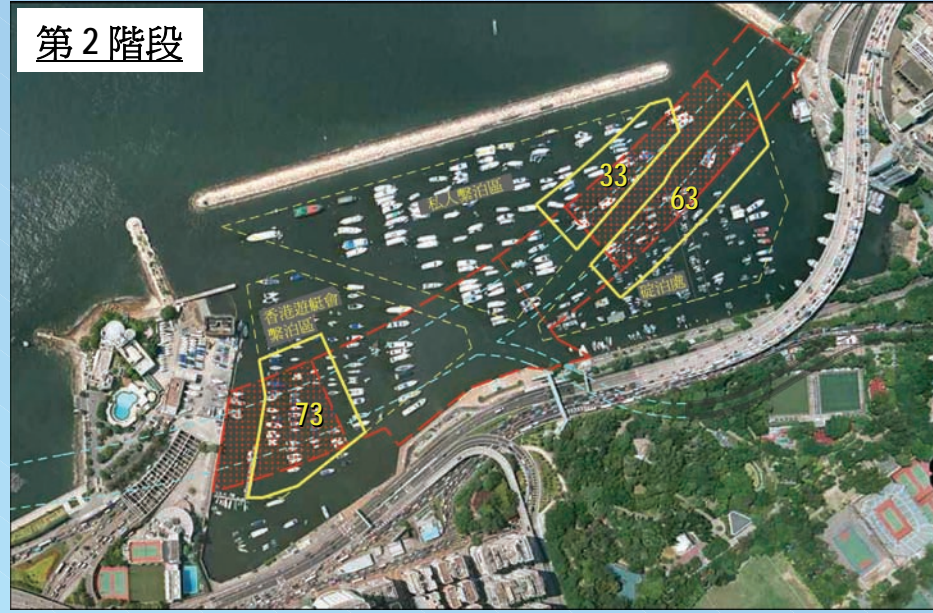
第 2 階段