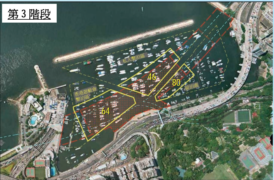
第 3 階段